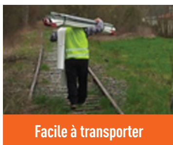
Facile à transporter