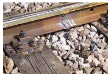
Joints de rails soudés