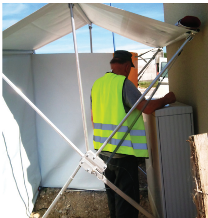
Maintenance des armoires électriques